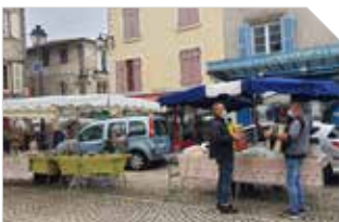
Bourganeuf en images P8