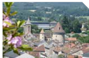
Vie pratique P11