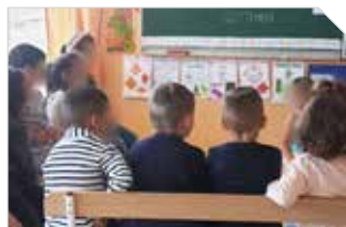
Enfance / Jeunesse P10