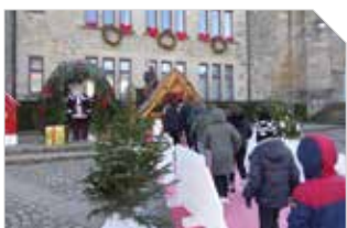
Bourganeuf en images P6