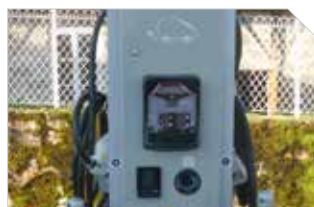
Environnement et Travaux P9